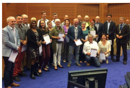
Deelnemers Politiek Actief.

Het politieke jaar 2015-2016 van de gemeenteraad van Meppel stond, zoals in het voorwoord al is aangegeven, naast het regulier raadswerk vooral in het teken van de komst van een AZC en het vertrek van de oude en de komst van de nieuwe burgemeester. Daarnaast is er vanuit raad en griffie energie gestoken in het betrekken van inwoners bij de lokale politiek. Naast de al enige jaren georganiseerde Democracy voor leerlingen in de basisschoolleeftijd is er ook de cursus Politiek Actief voor inwoners in samenwerking met Prodemos aangeboden. Deze cursus was bedoeld om potentiële raadsleden te informeren over het raadswerk (dit ook al met het oog op de gemeenteraadsverkiezingen in 2018), maar ook nadrukkelijk om inwoners inzicht te geven in de mogelijkheden om invloed uit te oefenen op de lokale besluitvorming.