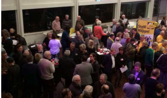
(Duo-)raadsleden en anderen tijdens de locatiekeuze informatiemarkt AZC.