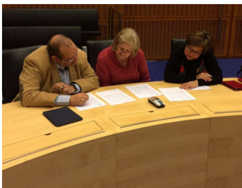
Geen nieuwe fractie, maar gezamenlijk aan de slag met het cursuswerk.