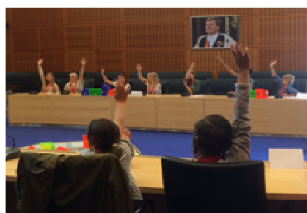
Democracy in de Raadzaal.