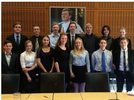
Winnaars MEP-debat 2016 Dingstede

Verder kan worden vermeld dat het webcastsysteem in 2015-2016 ook vanuit de griffie is ingezet voor het Model European Parliament (MEP) CSG Dingstede, de Koninklijke onderscheidingen in 2016, het Lagerhuisdebat Onderling Sterk Meppel en de presentatie van het boek "Tussenstation Meppel, Fritz Blasbalg op de vlucht voor Hitler".