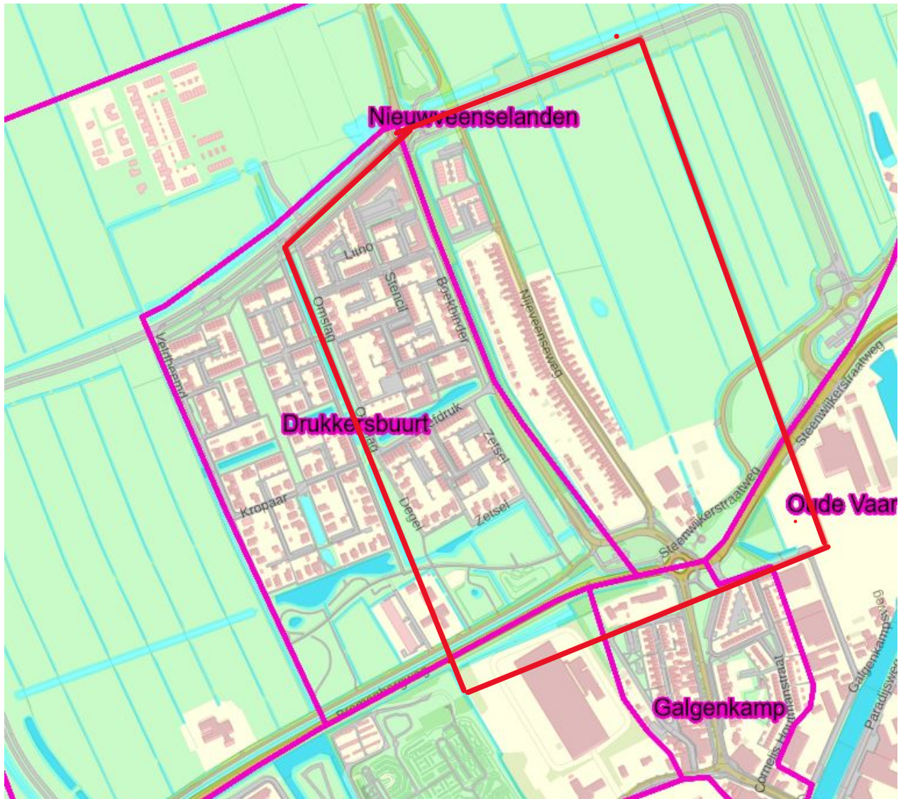
Gebied Nijeveenseweg. Binnen de rode lijnen geeft het gebied Nijeveenseweg aan waarin niet mag worden geparkeerd.