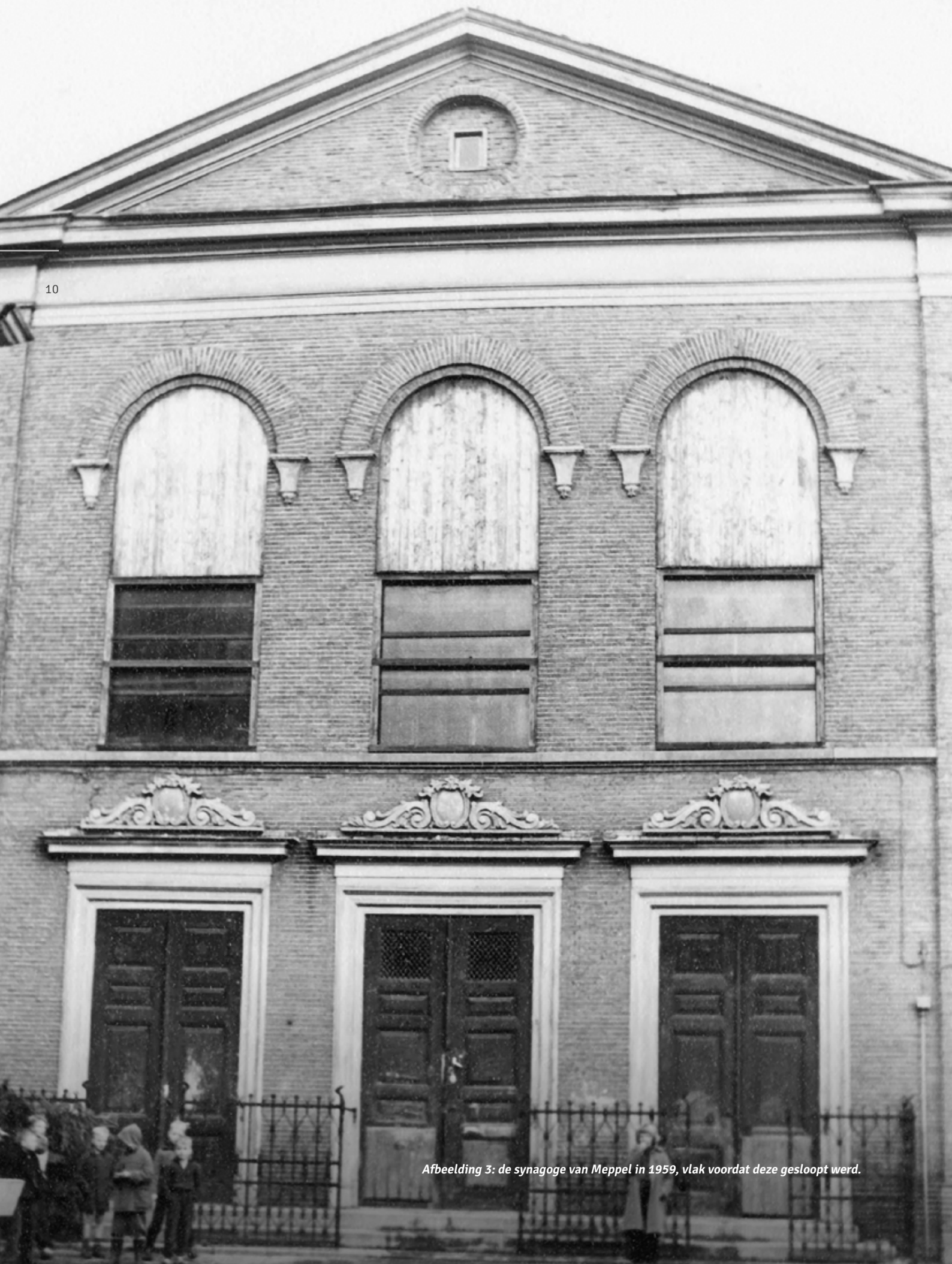
Afbeelding 3: de synagoge van Meppel in 1959, vlak voordat deze gesloopt werd.