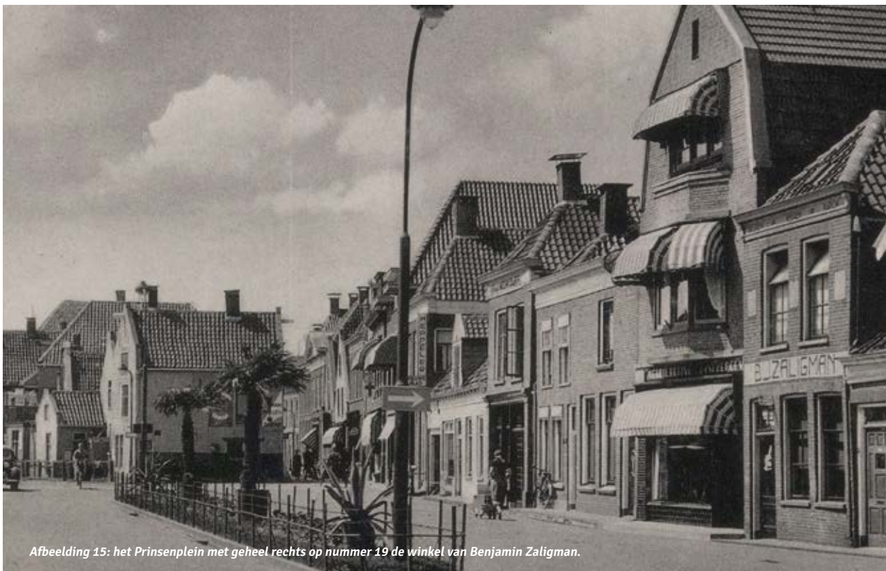
Afbeelding 15: het Prinsenplein met geheel rechts op nummer 19 de winkel van Benjamin Zaligman.