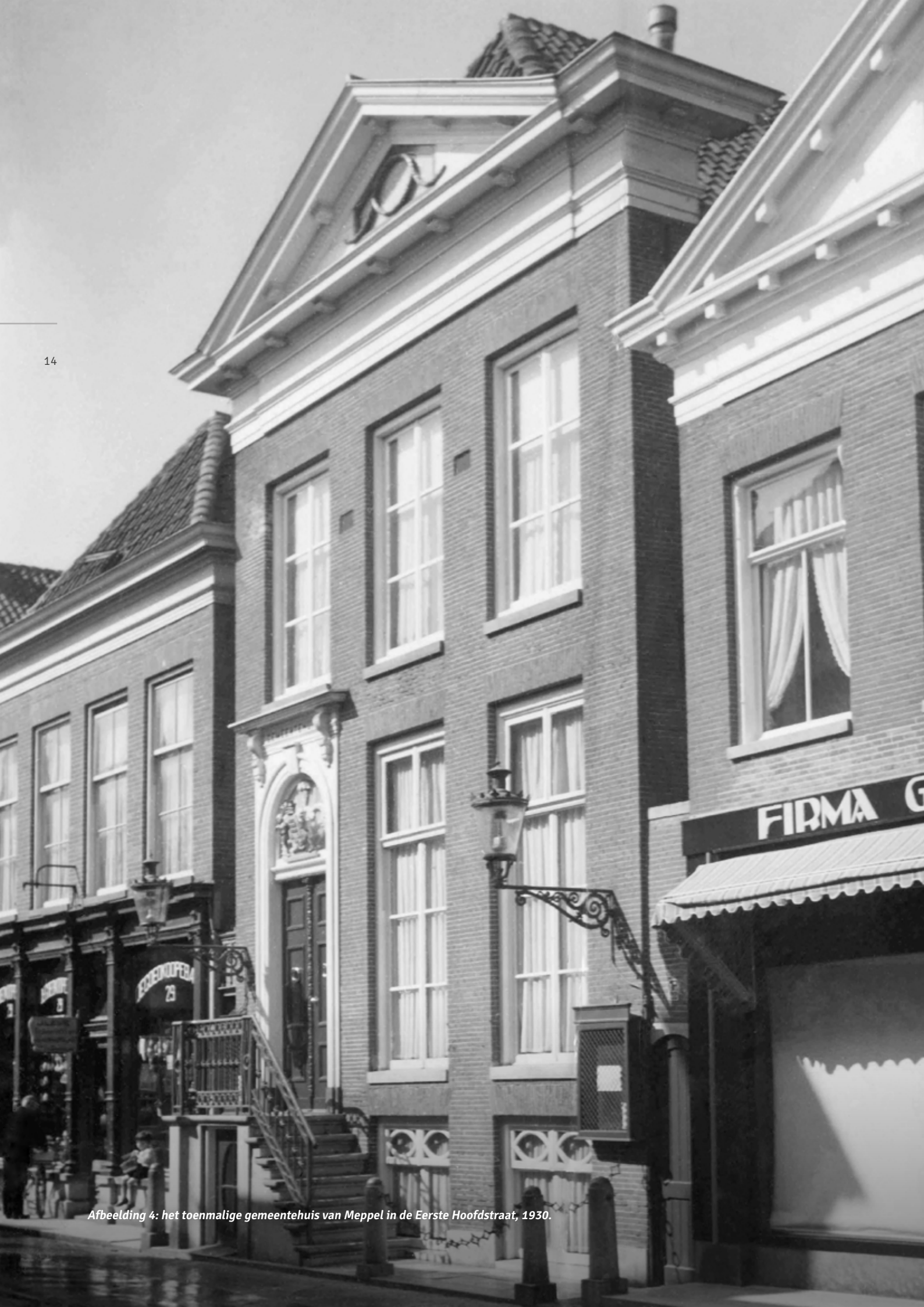
Afbeelding 4: het toenmalige gemeentehuis van Meppel in de Eerste Hoofdstraat, 1930.