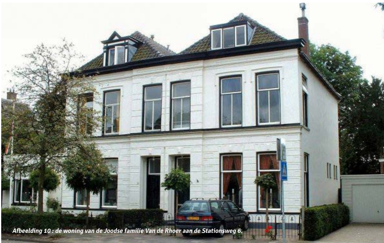
Afbeelding 10 : de woning van de Joodse familie Van de Rhoer aan de Stationsweg 6.